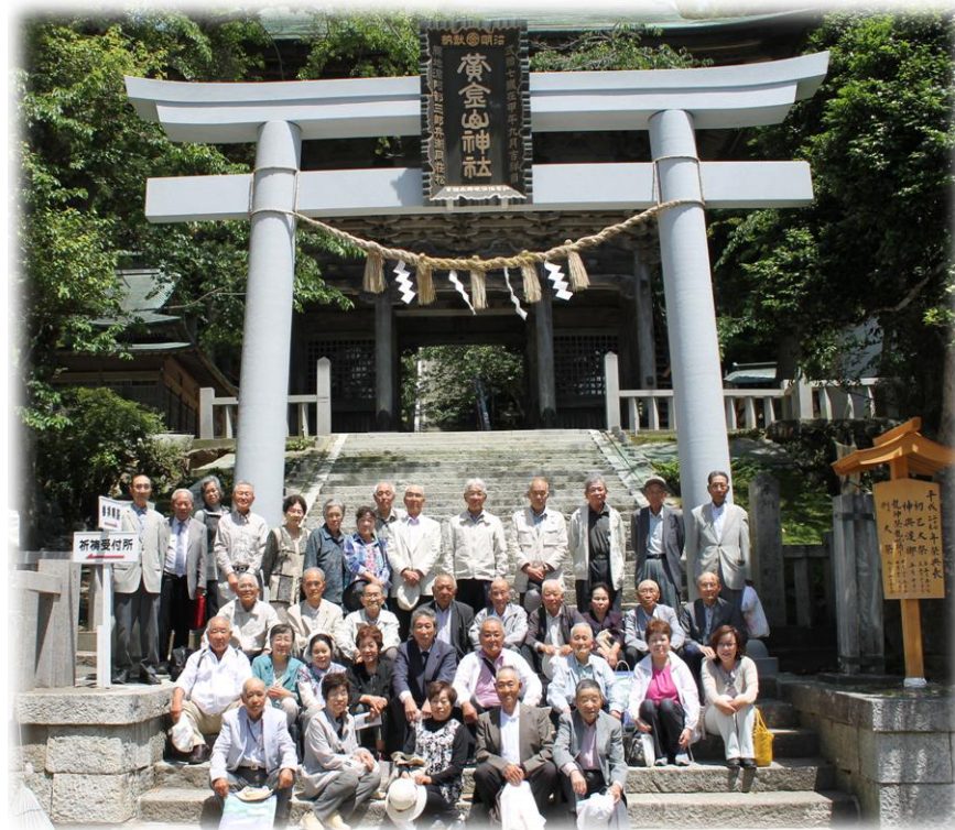
黄金山神社にて皆さんで記念写真