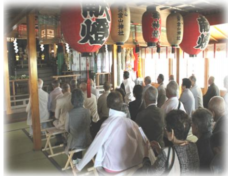
ご祈禱まえの様子

次回の第2回学習会は7月23日(木)を予定しておりますのでご参加お待ちしております！！