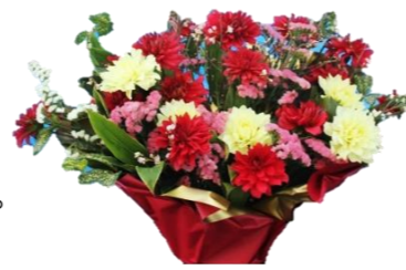
冬咲きダリヤの展示

今年も小松小学校グラウンドを会場に開催いたします。イベントでは“雪上かるた取り”“雪上宝さがし”“数字あて”“そりすべり”など雪あそびが体験できます。子供も、大人も存分に楽しんで下さい。牛くし、とん汁、玉こんにゃく（予定）などあったか〜い食べものや“ふるまい”も用意してお待ちしております。また、きれいに咲き誇った冬咲きダリヤも鑑賞できます。詳細につきましては別紙の雪まつりチラシをご確認下さい。 ※天候等により内容変更となる場合もございます。あらかじめご了承ください。